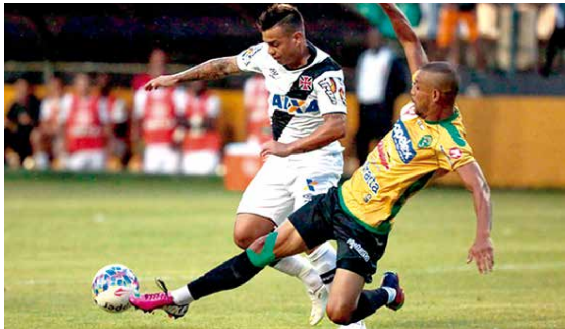
O Vasco da Gama, de Bernardo, vem tendo prejuízo com as disputas do Campeonato Carioca de 2015

clube que mais levou torcida foi o Fluminense: 5.812. Em seguida aparece o Vasco com 4.626 e o Botafogo com 4.180.