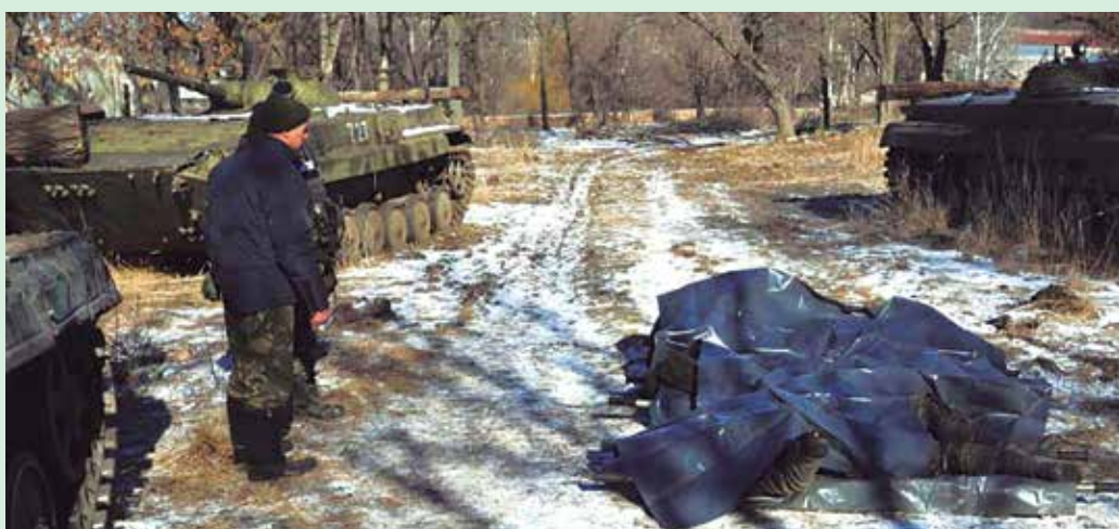
Militares ucranianos observam corpos de colegas mortos durante combate em Debaltseve

"Pare de armar os separatistas. Pare de mandar centenas de armas pesadas em toda a fronteira, além de suas tropas. Pare de fingir que você não está fazendo o que está fazendo. A Rússia assina acordos e, em seguida, faz tudo para enfraquecê-lo. A Rússia age como se as fronteiras de um vizinho não existissem", criticou.