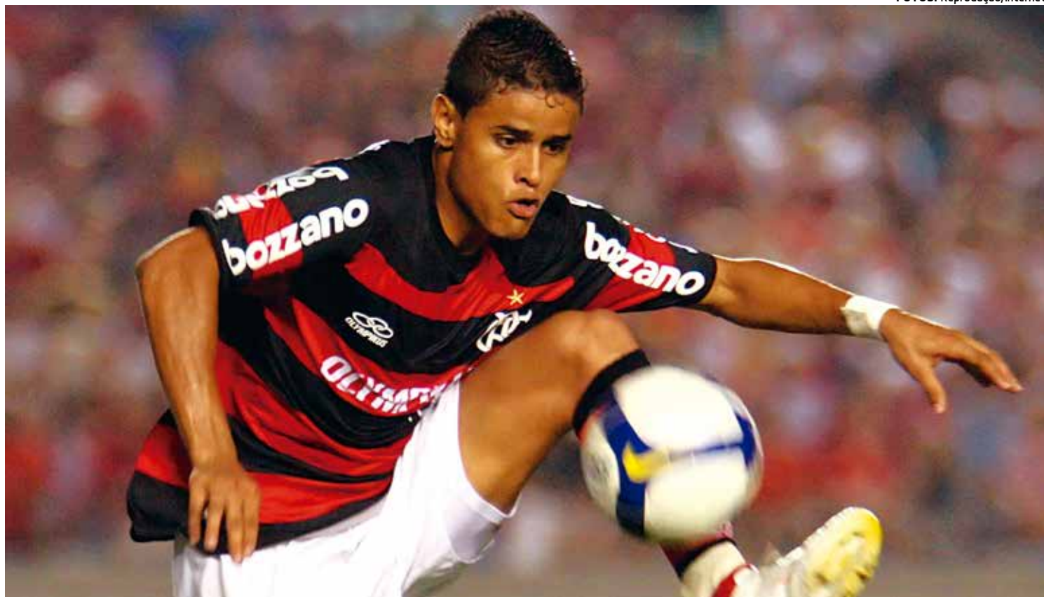
Everton controla a bola em jogo do Flamengo pelo Campeonato Carioca. O jogador prevê dificuldades para vencer o Boa Vista hoje

O resultado está diretamente ligado ao preço estipulado por cada clube na venda dos ingressos e quanto cada um conseguiu levar aos estádios. O Flamengo é quem mais levou torcedor nessas quatro primeiras rodadas: média de 10.364. O segundo