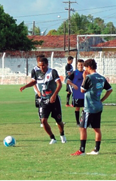
Belo treinou ontem antes de viajar