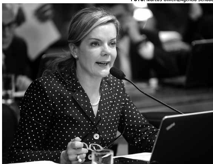
Senadora pede ajuste para conter agressor durante o inquérito

Consta ainda do rol de medidas de proteção o encarceramento da vítima e dos filhos a um programa oficial de proteção, a autorização para que a vítima deixe a casa, sem prejuízo dos direitos relativos a bens e guarda dos filhos, e a determinação da separação de corpos.