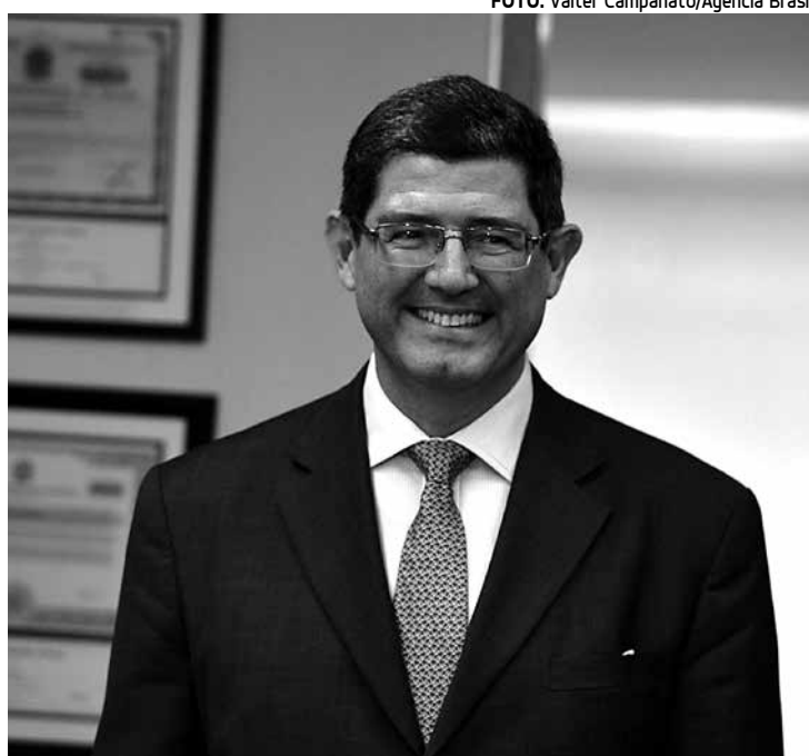
Ministro da Fazenda tem defendido medidas para o ajuste fiscal

Na apresentação, Levy defendeu, entre outras coisas, as concessões como um caminho para expandir a infraestrutura do país nos próximos 20 anos, com a