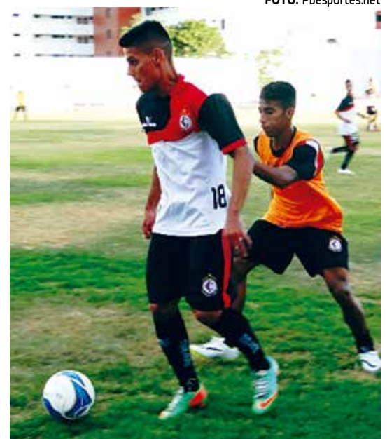
Treino da Raposa visando o jogo em Maceió