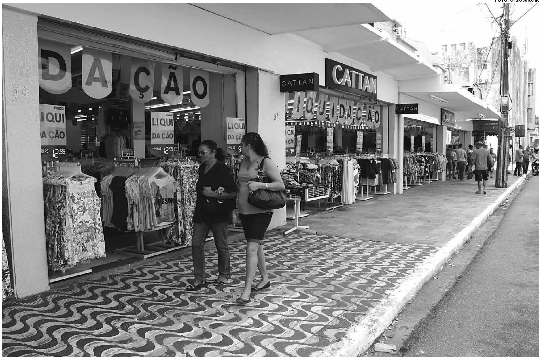
Um número pequeno de consumidores foi às compras nas lojas do Centro de João Pessoa; somente farmácias e livrarias tiveram boas vendas após o feriadão

Muita gente está procurando a loja para fazer pagamento de carnês. "Abrimos às 12h e vamos fechar às 19h", disse.