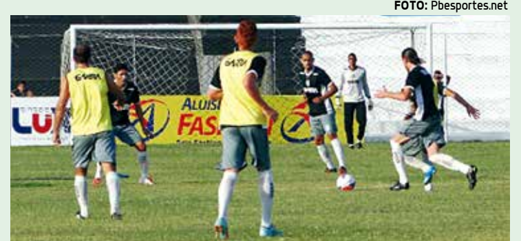
Jogadores do Galo treinam com muita disposição durante coletivo

O Tubarão do Norte está na oitava colocação, com apenas 3 pontos, em cinco jogos disputados. Já o Santa Cruz está numa situação melhor do que o adversário. O Tricolor de Santa Rita está na quinta colocação, com 8 pontos conquistados em seis jogos. Se vencer, a equipe de Mirandinha entra no G4, na zona de classificação, ultrapassando o Sousa, que não joga neste meio de semana.