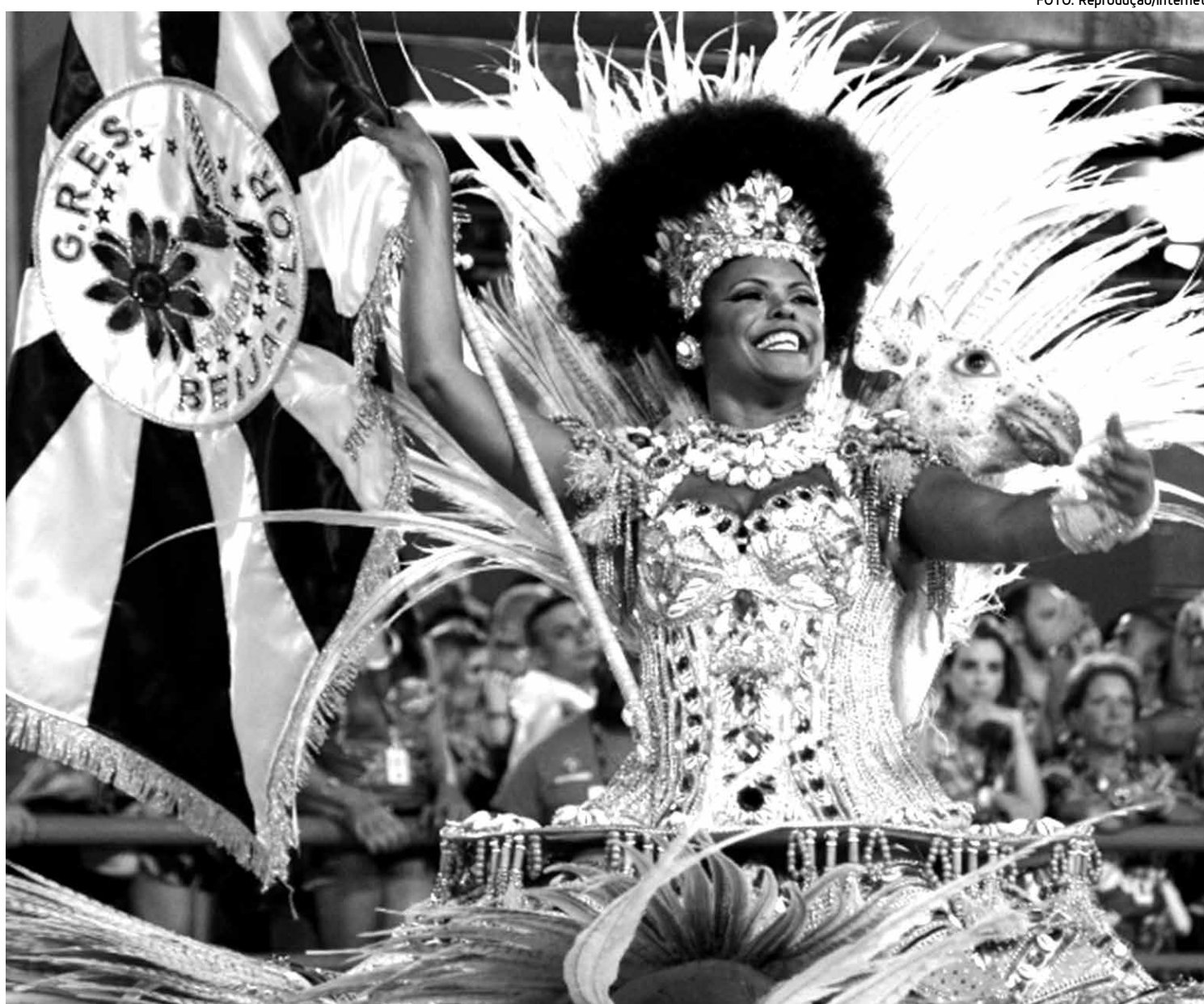
A Beija-Flor foi a terceira escola de samba a entrar na Marquês Sapucaí na segunda noite de desfiles do Carnaval do Rio de Janeiro

As seis melhores colocadas voltam à avenida no próximo sábado, dia 21, a partir das 20h30, para o