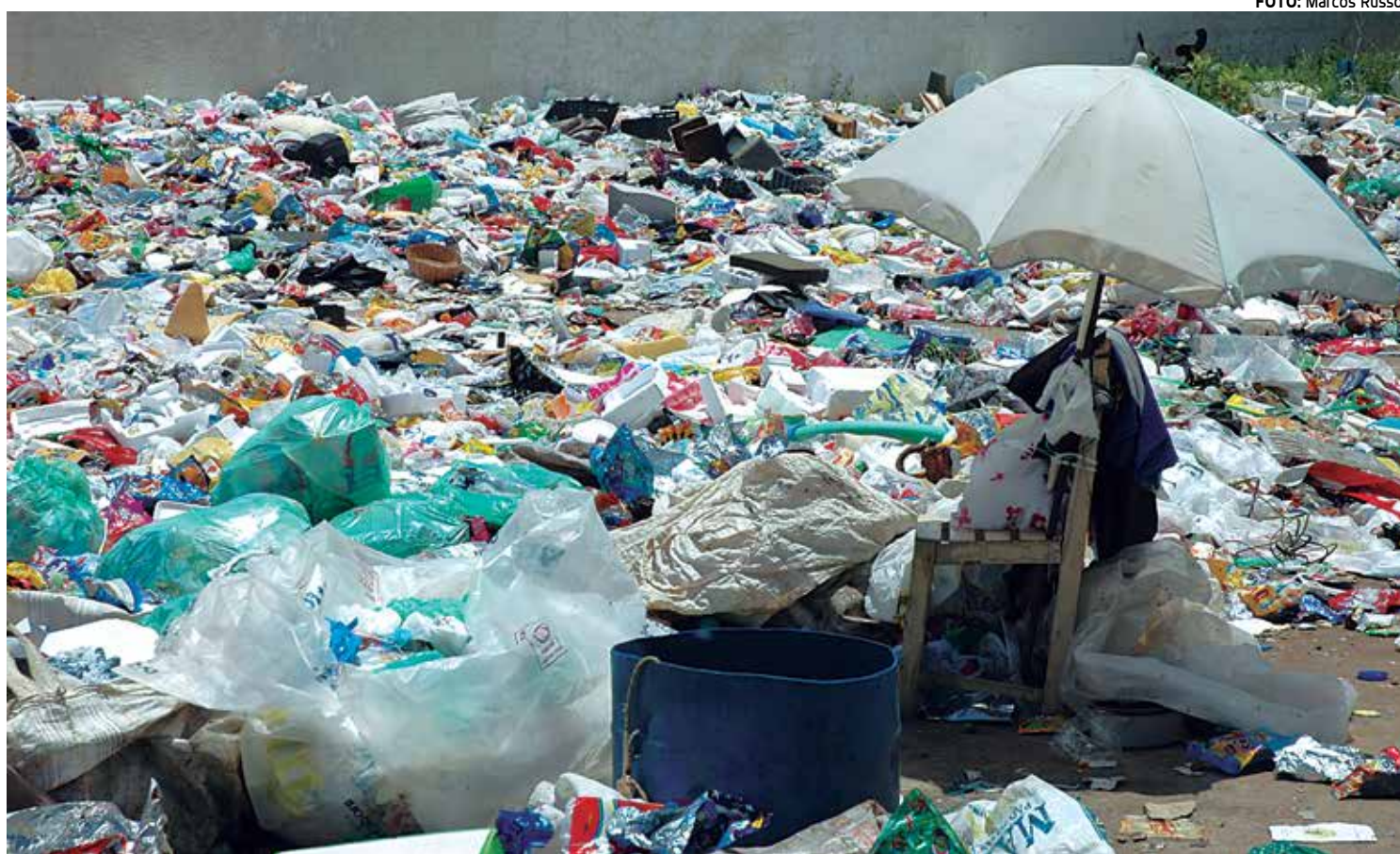
Locais de colocação dos resíduos sólidos, os lixões, deverão ser previamente informados, junto com a situação dos catadores

Até antes do Carnaval, a Seplag havia registrado 107 adesões dos promotores de Justiça aos projetos da Gestão Estratégica 2015 da instituição. Desse total, 63 foram de adesões aos projetos estratégicos ligados à temática transversal de enfrentamento às drogas e 44 aos outros três projetos de temáticas diversas, nas áreas do consumidor, do meio ambiente (o Projeto 3Rs - Reduzir, Reutilizar e Reciclar) e do