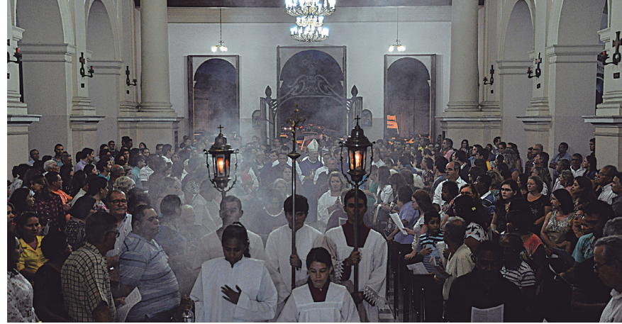
A abertura do período da Quaresma ocorreu com a Missa de Cinzas, ontem