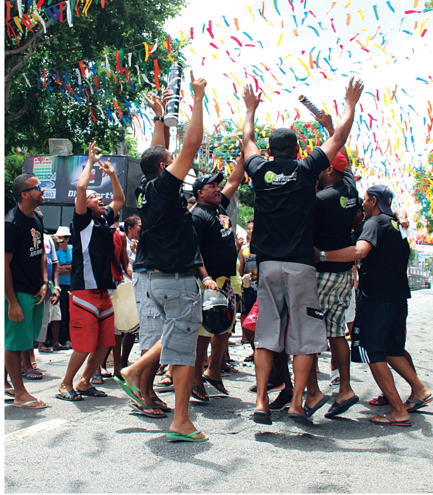
Integrantes da Tribo Africanos festejam a conquista do 1º lugar na categoria