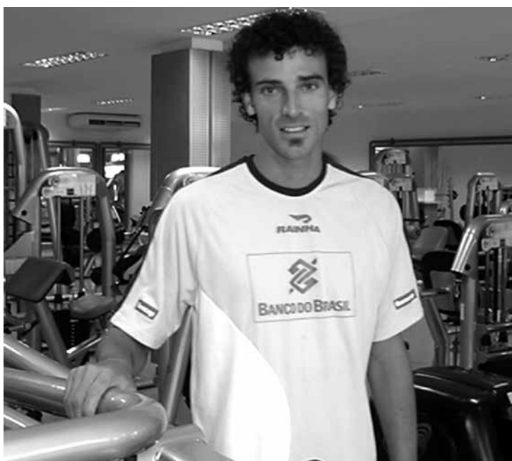
A ginasta Daiane dos Santos, o jogador de vôlei de praia Emanuel, as gêmeas Bia e Branca do nado sincronizado e os ex-jogadores de vôlei, Leila e Giba

grande oportunidade de colocar o Brasil a nível mundial” avalia.