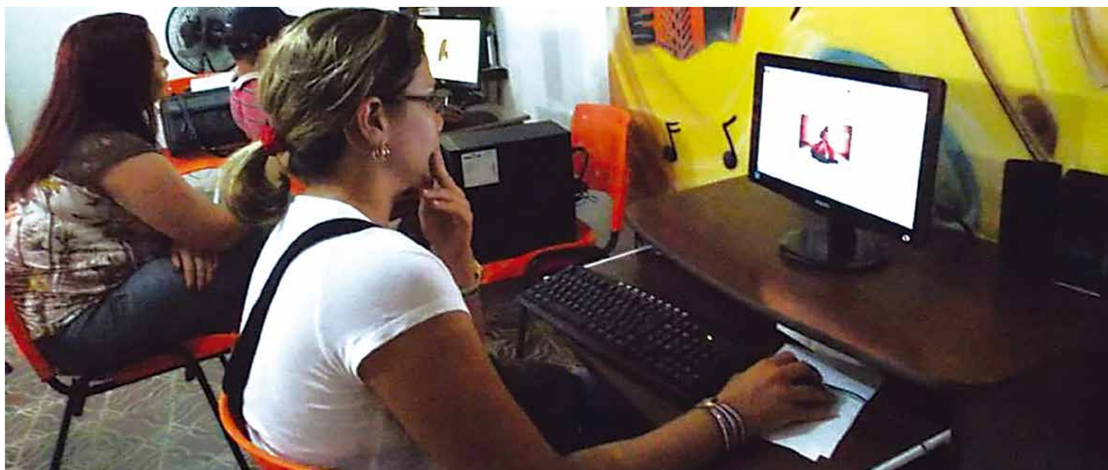
A associação artística realiza um trabalho permanente de capacitação, principalmente ligado ao desenvolvimento de técnicas e de projetos destinados à área cultural