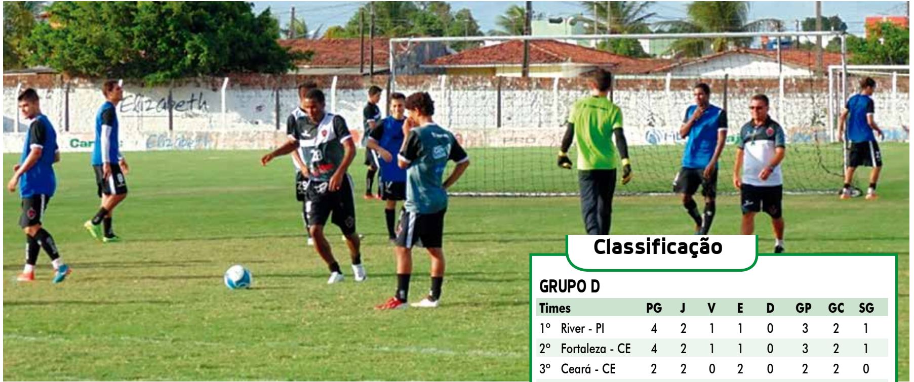
Antes de embarcar, ontem, os jogadores participaram de um treino na Maravilha do Contorno