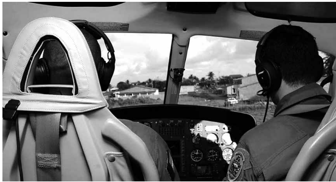
O helicóptero Acauã atuou em resgates terrestres e aquáticos na capital e nos Litorais Sul e Norte