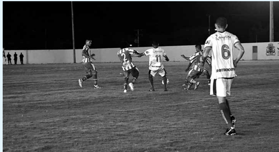
O Auto que faz uma boa campanha no Estadual vive o dilema dos atletas machucados

"Sabemos que teremos uma pedreira pela frente e queremos contar com uma equipe mais experiente para buscar um resultado positivo. Estou na torcida para que esses jogadores sejam liberados do Departamento Médico do clube e