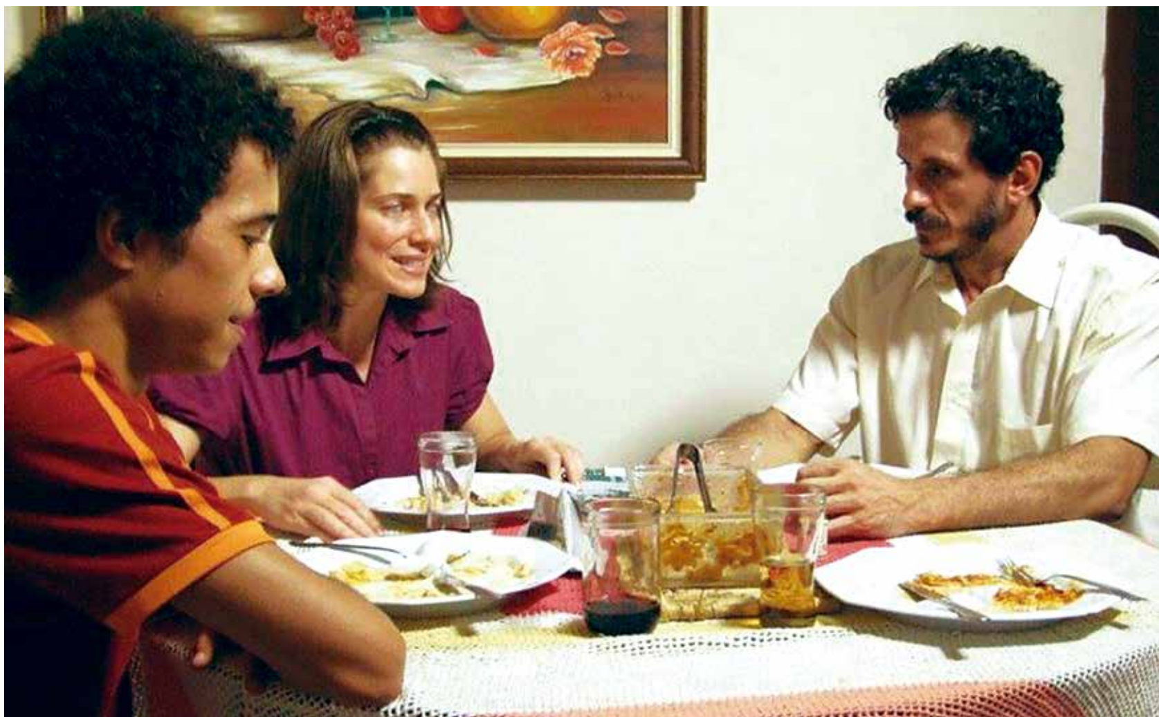
Nesta cena, o personagem Miguel Arcanjo escuta as histórias que o vizinho João conta para Maura, uma amiga que é cega

temos grana para bancar distribuição, estamos fazendo uma distribuição totalmente independente e feita na parceria com amigos, mas que está conseguindo alçar altos voos devido aceitação que o filme está tendo junto ao público", explica ele